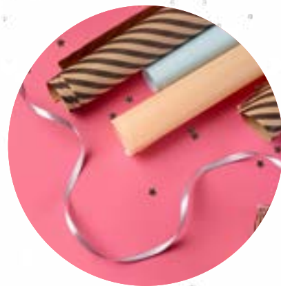
Un paquet cadeau