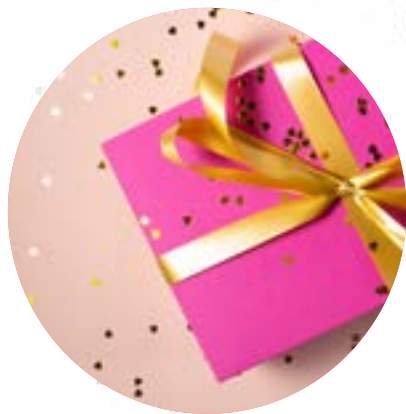
Un cadeau d'anniversaire