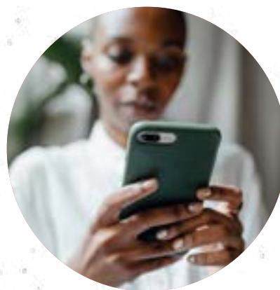
Envoyer un message