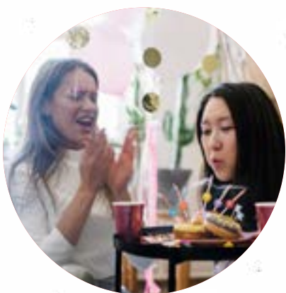
Joyeux anniversaire !