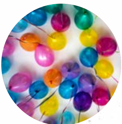
Organiser une fête