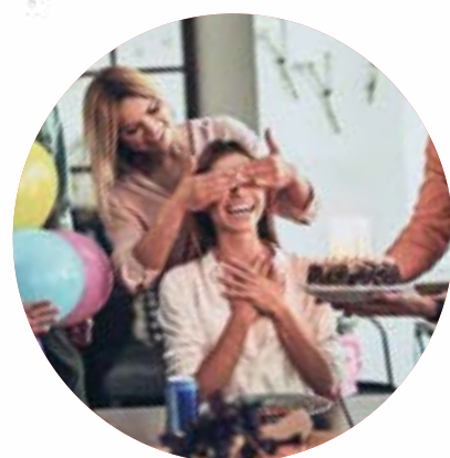
Faire une surprise